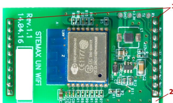
Рисунок 3.1 – Внешний вид модуля сверху

Внешний вид модуля сверху представлен на иллюстрации (см. рисунок 3.1).